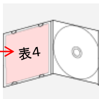
表4：広告面 (ケースを開いた左側)